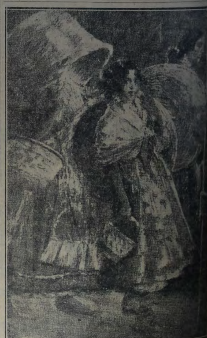
"CANASTILLERAS GITANAS", de José Villegas, expuesta en el mismo salón