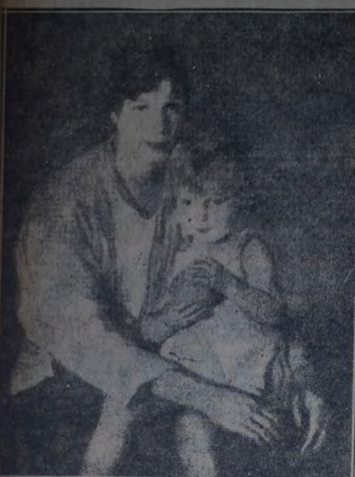
"MADRE" tela de José Sotomayor, que figura en la exposición de pintura española recientemente inaugurada en el salón Witcomb